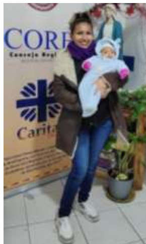
Nacimiento de una nueva usuaria.