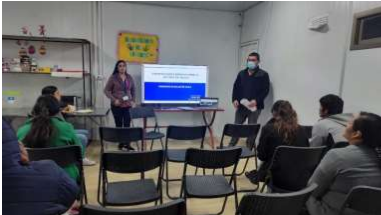
Charla sobre “orientaciones básicas sobre el sistema de salud en Chile”